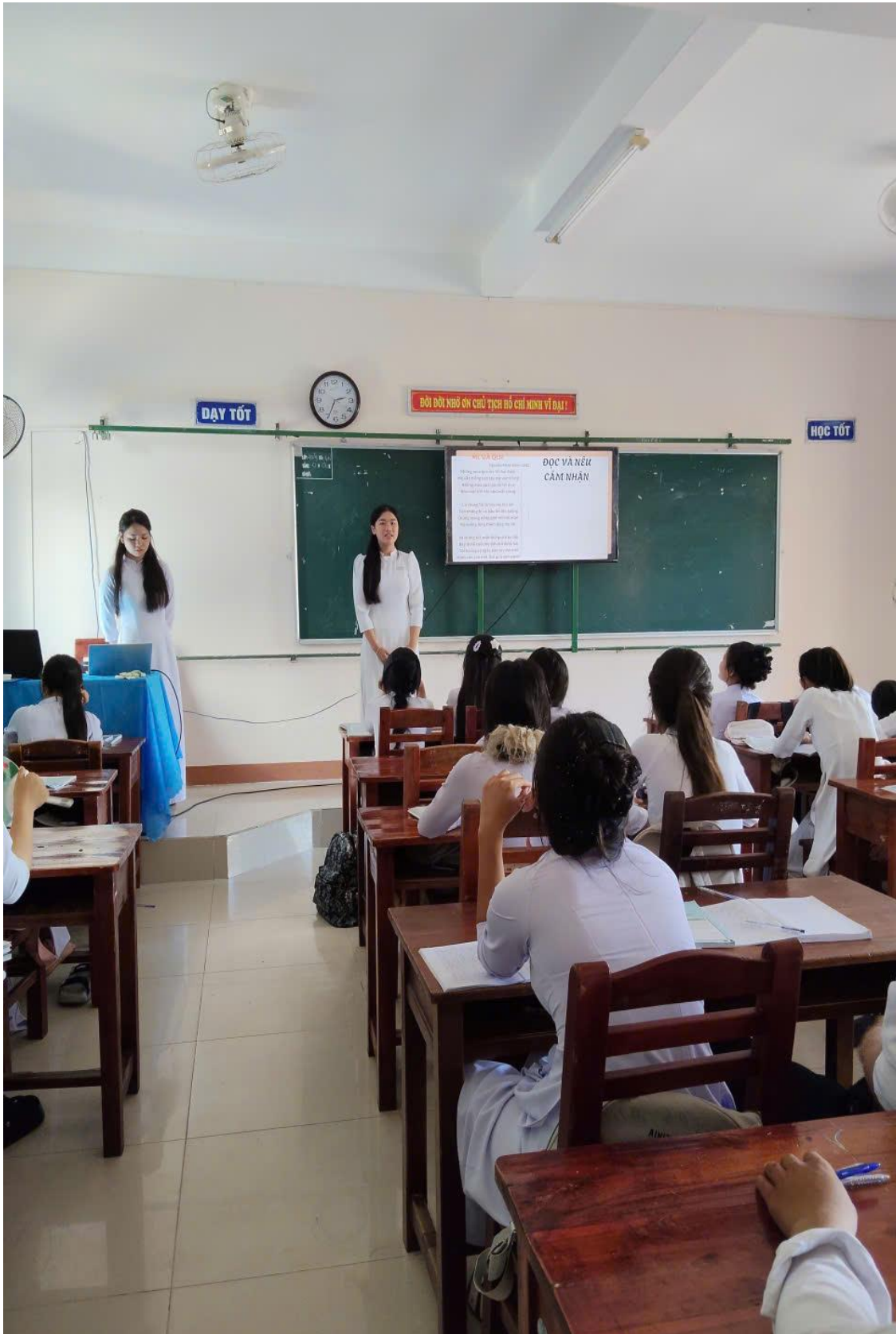
Thuyết trình Giới thiệu, đánh giá về nội dung và nghệ thuật của một tác phẩm thơ