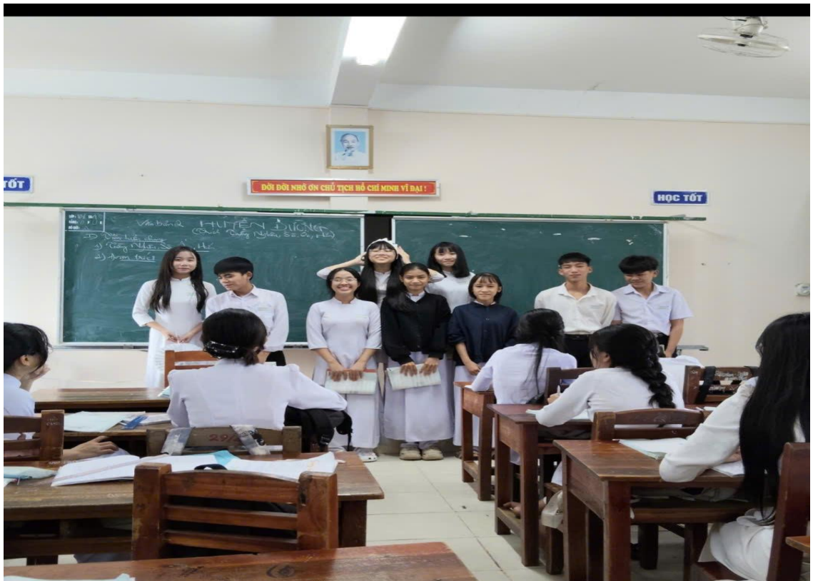
Đóng vai nhân vật- văn bản Huyện đường