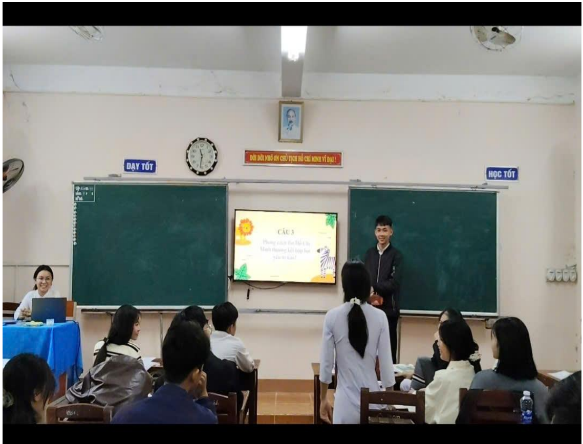
Tương tác trong trình bày Dự án Tìm hiểu thơ Hồ Chí Minh