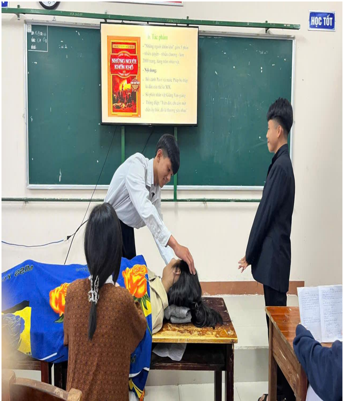
Đóng vai nhân vật - văn bản Người cầm quyền khôi phục uy quyền